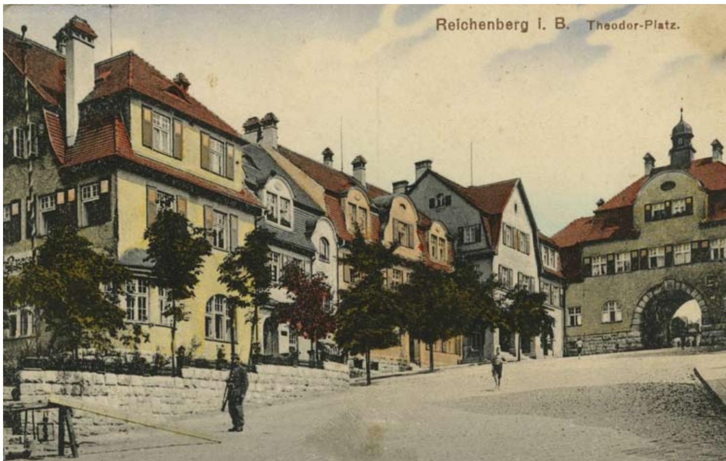
NAHOŘE: Náměstí Pod Branou, dobová pohlednice, 1918 | DOLE: Liebiegovo městečko, Svatoplukova ulice, cca 1920–1930

text vychází z monografie architekta Jacoba Schmeissnera autorky Petry Šternové