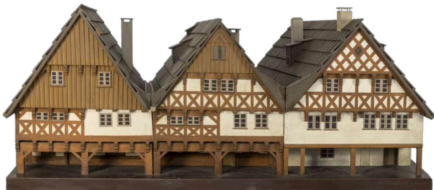
Valdštejnské domky | Tři domky s hrázděnými domovními štíty ve Větrné uličce spadají do období výstavby Novoměstského náměstí. Byly vystavěny v letech 1678–1682 už po smrti vévody Albrechta z Valdštejna a sloužily k ubytování soukeníků. Dřevěný model představuje celistvou podobu domů, dnes existuje pouze průčelní část, zadní strana se zhroutil v 50. letech 20. století.