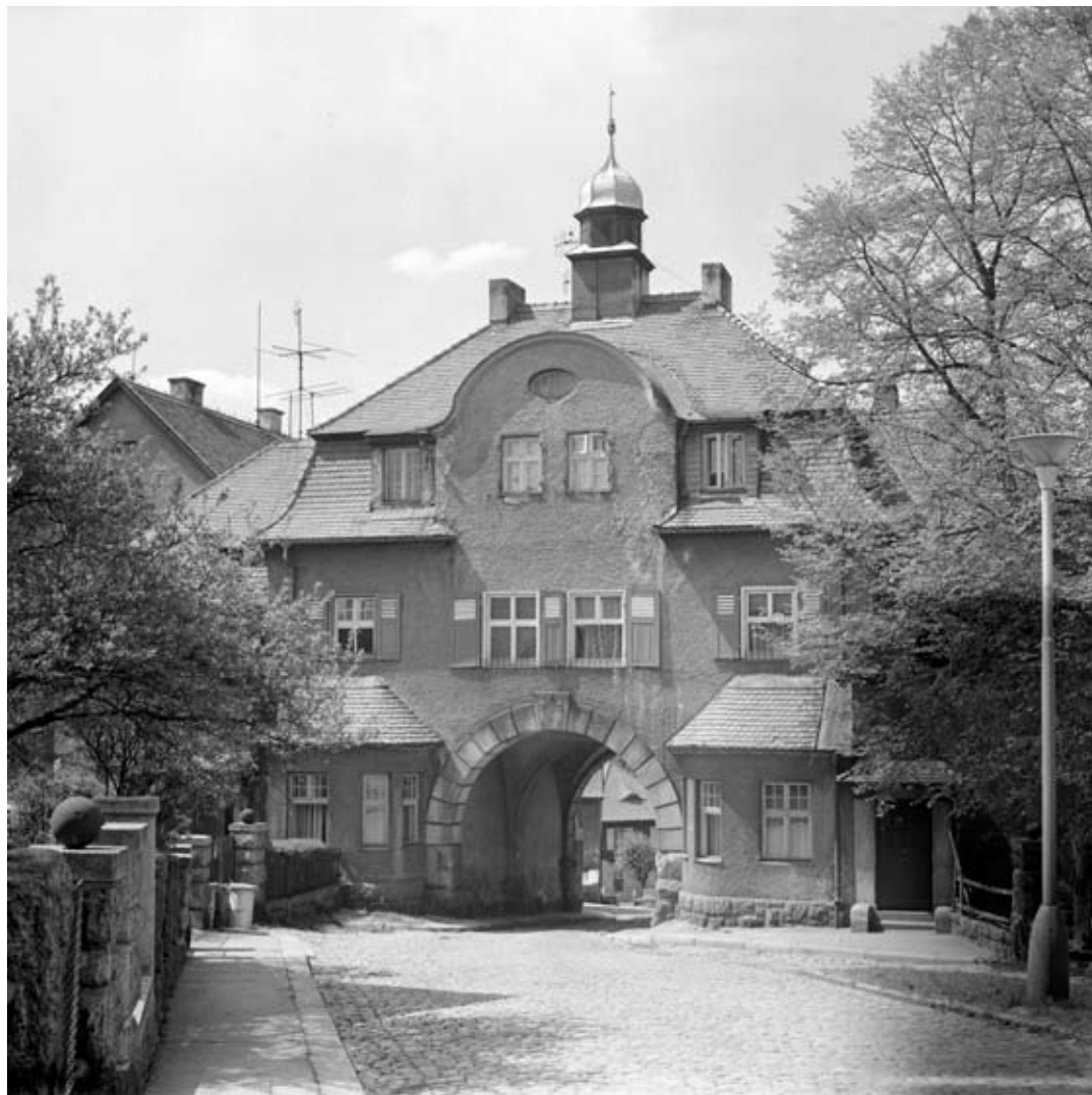
NAHOŘE: Horní vjezd od Plátenické ulice na nám. Pod Branou, r. 1974 | DOLE: Náměstí Pod Branou před úpravami zateplením