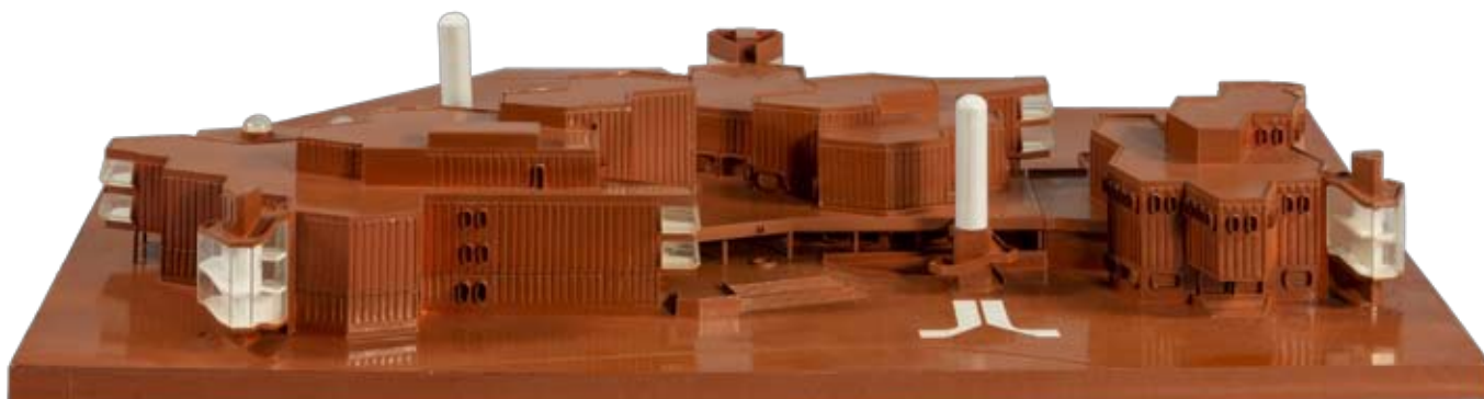
Obchodní dům Ještěd | Plastový model z roku 1969 jednoho ze symbolů Liberce, obchodního domu Ještěd, je ukázkou nástupu silné generace architektů SIAL. Autorem projektu byl Miroslav Masák spolu s Karlem Hubáčkem. Obchodní dům byl postaven v letech 1970–1979. Tvorbě interiérů se ujali spolupracovníci ze Školky SIAL. Projekt je unikátním příkladem osobitého řešení v intencích tzv. strukturalistické architektury v návaznosti na nerealizované velkorysé urbanistické záměry dolního centra v Liberci. Objekt byl zbourán v roce 2009. Zapůjčeno z Národního technického muzea.