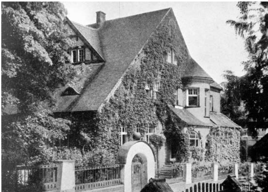
NAHOŘE: Jesle v Liebiegově městečku, arch. Ernst Schäffer, poč. 20. stol. | DOLE: Sídliště Domovina, r. 1920–1925