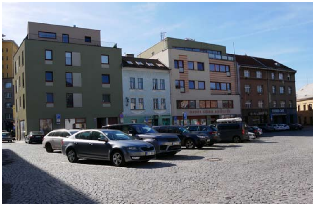
NAHOŘE: Ulice Na Příkopě | DOLE: Současná podoba Papírového náměstí