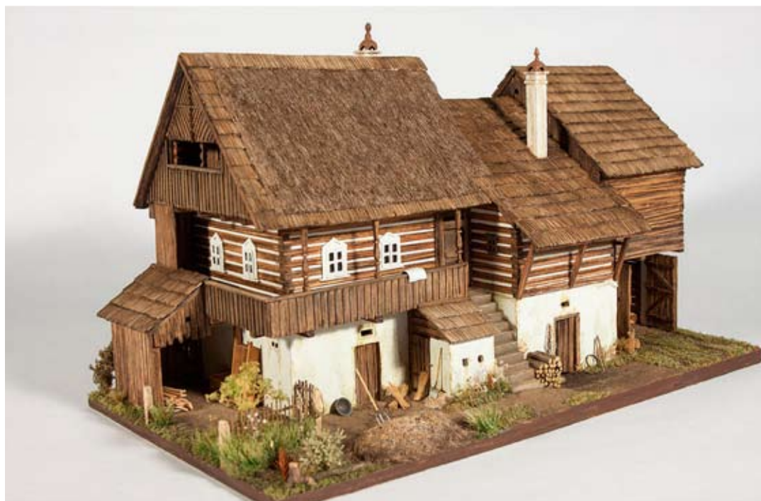
NAHOŘE: Model kovárny, Bílá, Českosudsko | DOLE: Model stavení z okolí Rovenska pod Troskami