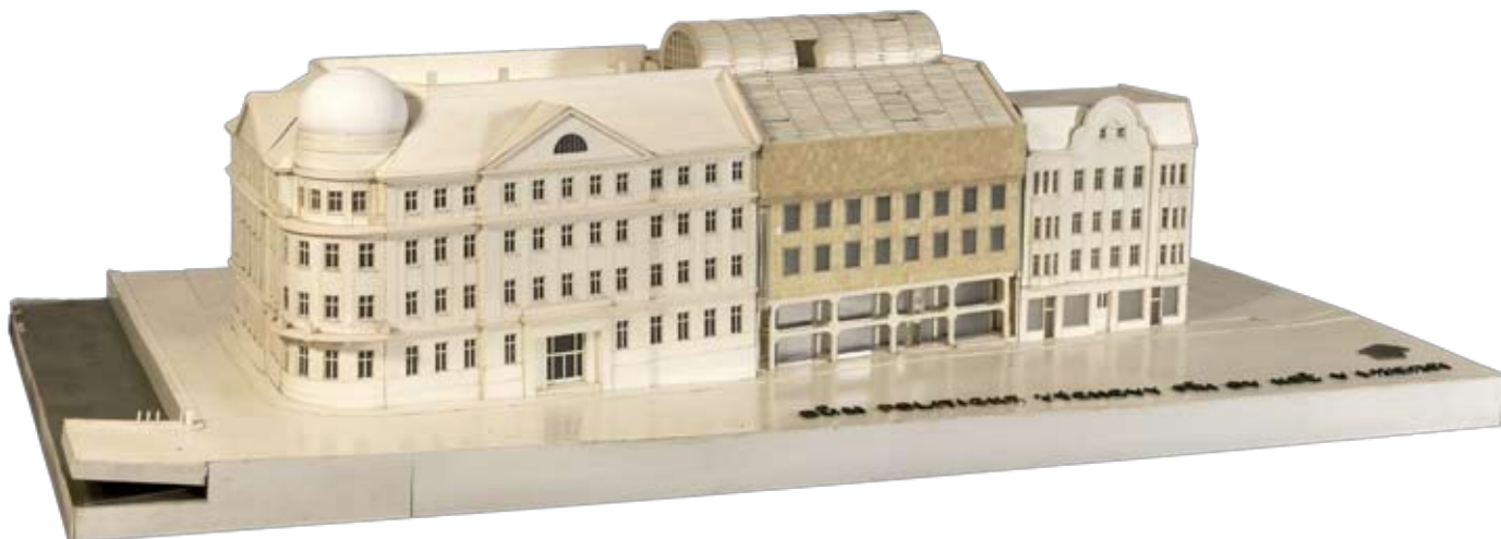
Dům politické výchovy | Návrh administrativní budovy OV KSČ, později Domu politické výchovy, pochází z projekčního podniku Stavoprojekt Liberec architekta Pavla Švancera z roku 1987. Model ukazuje Švancerovu zástavbu tehdejší proluky v ulici 1. máje. Zajímavě řešená fasáda s výrazným parterem vynesená na ocelových pilířích přispěla k postmodernímu vyznění. V nedávné době prošla fasáda přestavbou a unikátní ráz celé budovy se tak nezvratně změnil. Změna podoby fasády celého domu patří ke ztrátám hodnotné architektury 80. let minulého století v Liberci.