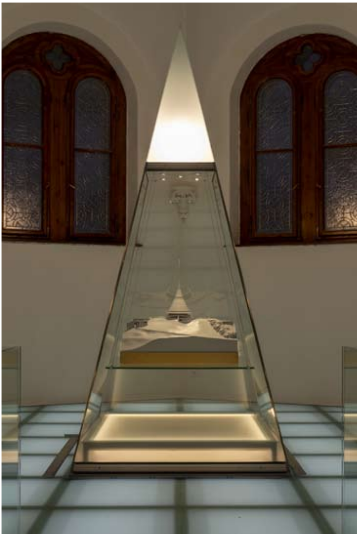
NAHOŘE: Model vysílače a hotelu na Ještědu, záplývka z Národního technického muzea | DOLE A NA TITULNÍ STRANĚ: Pohled do výstavy Liberec kontra Reichenberg ve velkém sále Severočeského muzea