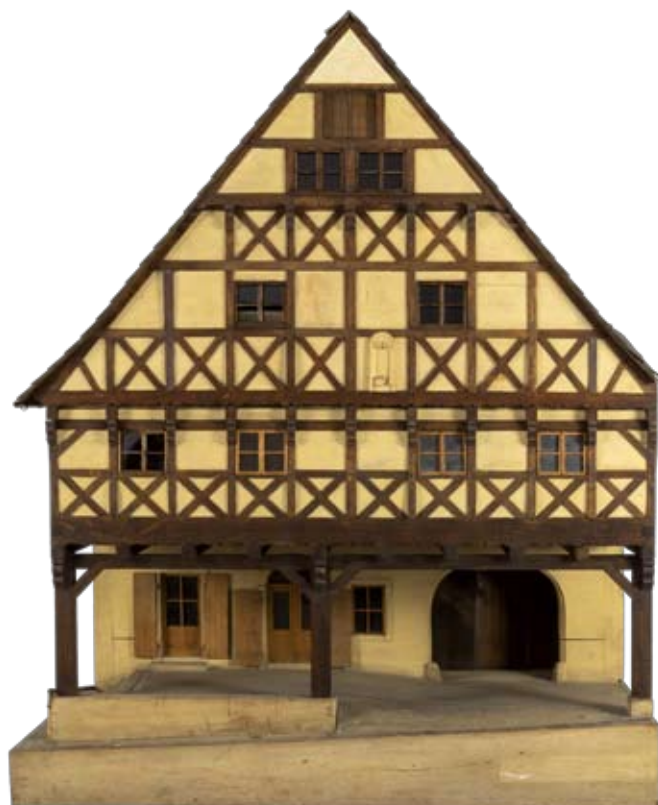
Hostinec U Zlaté koruny | Hostinec č. p. 183, tzv. Fouskův dům, stál na severozápadním rohu bývalého Staroměstského náměstí (dnes náměstí Dr. E. Beneše). Byl založen v roce 1670 a zbořen při stavbě radnice v roce 1881. Jedná se o raně barokní budovu s hrázděným patrem a štítem.

Mnohé modely, zejména ty, které se snaží vyřešit situaci centra Liberce, reflektují nedotaženost urbanistických řešení města, ale zároveň jsou inspirujícím doplněním dnešní diskuze k budoucímu směřování zástavby, která je nejcitlivěji vnímána obyvateli právě dnes. Raritní dobový model sídliště Králův Háj, model Strossovy vily, horského hotelu a vysílače Ještěd a modely z okruhu architektů SIAL dokumentují povedené realizace či návrhy, které Liberec upevnily v pozici zajímavého městského prostoru otevřeného tvůrčím počínům talentovaných architektů. ■