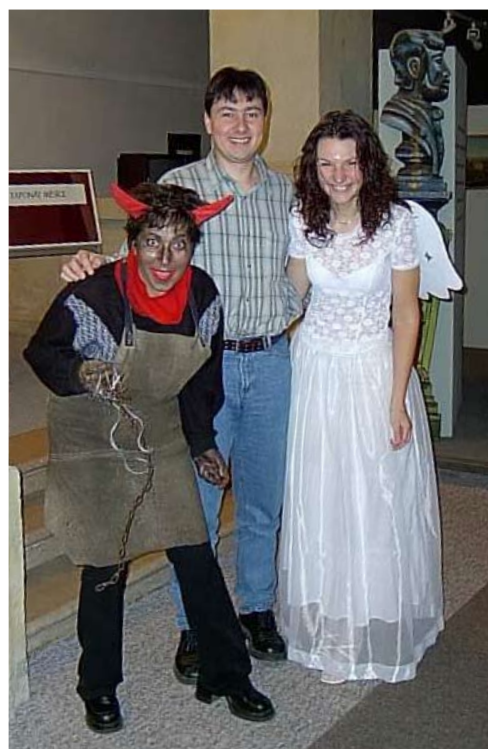
Z mikulášské nadílky v Severočeském muzeu, r. 2005.