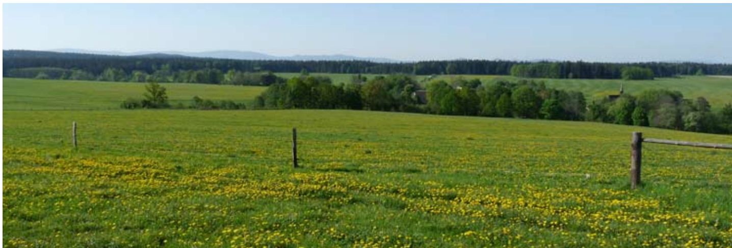
Pastviny u Dolní Oldříše představují charakteristický biotop krajiny Frýdlantska. Jedná se o hnízdiště mnoha lučních a polních druhů. Tato skupina ptáků patří v současnosti k nejohroženějším.

Mapovací práce vyžadují zkušenosti s touto metodou. Na Liberecku bohužel není dostatek takto zkušených ornitologů, proto se do terénních prací zapojují ornitologové doslova z celé České republiky. A právě nedostatečný počet odborníků zapříčinil zdržení celého mapování, které bude muset být oproti původním předpokladům dokončeno až v příštím roce. Poté budou výsledky zpracovány a publikovány. ■