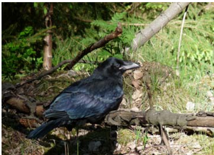
Krkavec velký hnízdí řídko, ale plošně po celém Frýdlantsku. Tento „mládík“ se vylíhl v hnízdě nedaleko Pertoltic.

Jedním ze způsobů, jak zpracovat rozšíření ptáků na větším území, je takzvané síťové mapování. Území je rozděleno sítí pomyslných čar na jednotlivé čtverce a v každém čtverci se prokazuje hnízdní dané metodiky. Způsob prokazování hnízdní je mezinárodně sjednocen tak, aby byly výsledky srovnatelné. Velikost čtverců a tedy hustota sítě se odvíjí od velikosti