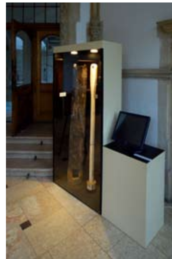
Vystavené zbytky pumpy z dolu Zeche.

Návštěvníci, kteří přišli do muzea na začátku října, si mohli všimnout několika změn. Ve vstupním vestibulu vyrostla nová vitrína s podivnými dřevy. Je to první vlašťovka spolupráce SM a České speleologické společnosti ZO 4–01 Liberec a ona „dřeva“ jsou zbytky důlní pumpy z Kryštofova údolí z roku 1704. Slavnostní vestibul byl naopak zahalen do mlhy igelitové fólie, neboť tu probíhala obnova původní podlahy, tzv. terrazzo. A čekají nás i změny podstatné. Již v roce 2012 začne obměna stálé expozice. Prvním krokem bude vytvoření hudebního salonu s interaktivní prezentací mechanických hudebních automatů. ■