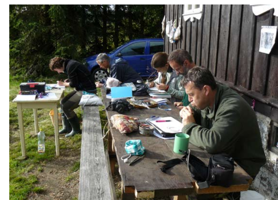
Kroužkování a měření na terénní stanici Jizerka